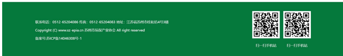
图 2.2-1 一次网络公示截图