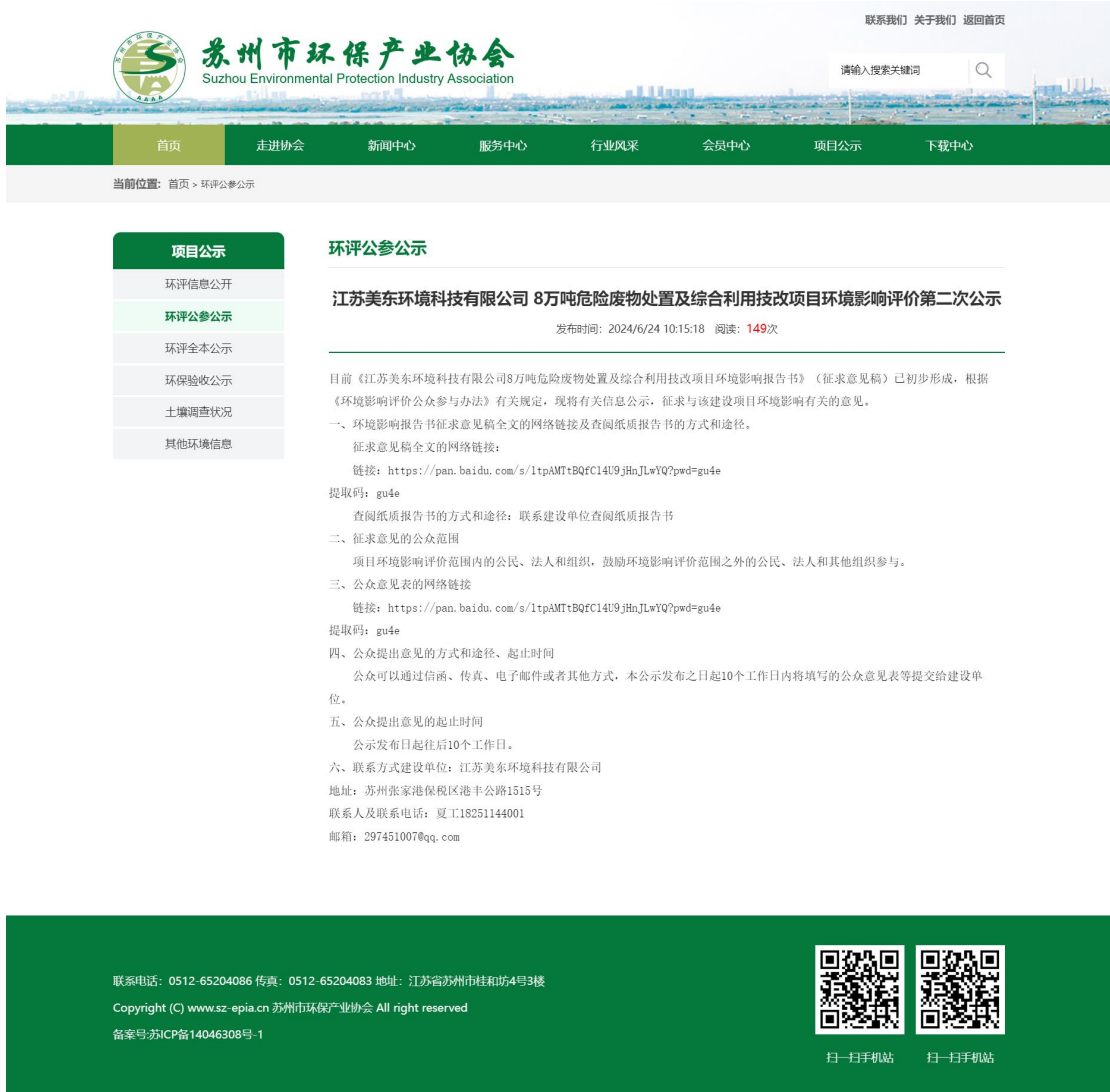
图 3.2-1 二次网络公示截图