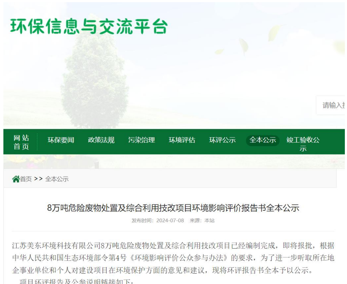
图 6.2-1 全本公示截屏

建设单位于 2024 年 7 月 8 日在环保信息与交流平台网站上 http://qikeshu.com.cn/?list_6/520.html 进行了全本公示。全本网络公示见图 6.2-1。