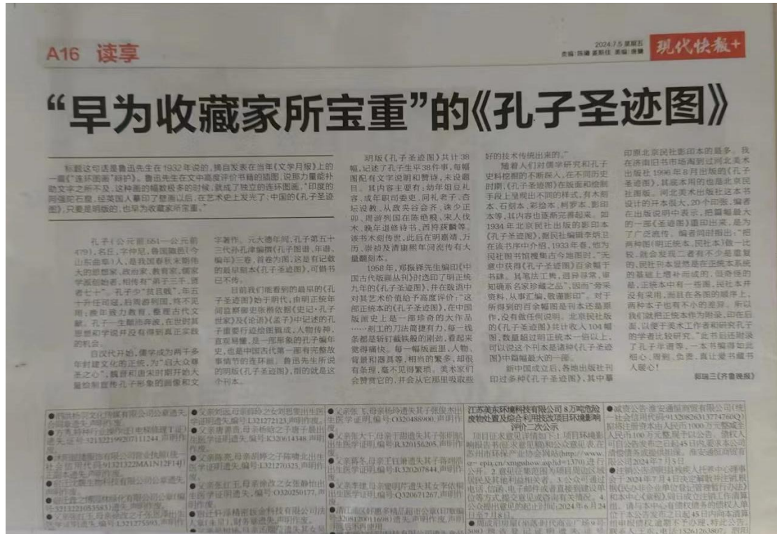
图 3.2-3 报纸第一次公示

现代快报是江苏省内主流媒体，在张家港有较高的市场占有率。为提高本项目环境影响评价公众参与的广泛性、便利性、真实性，我公司选取现代快报进行环评信息公示，载体选取符合相关要求。